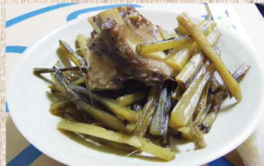
▲豚骨とアサミを一緒に煮込んだ料理

旧暦1月1日の旧正月に奄美市笠利町の節田集落で行なわれる。 新年を迎えて大勢の男女が集まり、それぞれ向い合って座る。三味線と太鼓に合わせて歌い、向き合った男女が手を叩きあったり、高く低く手舞をしたりを繰り返す。